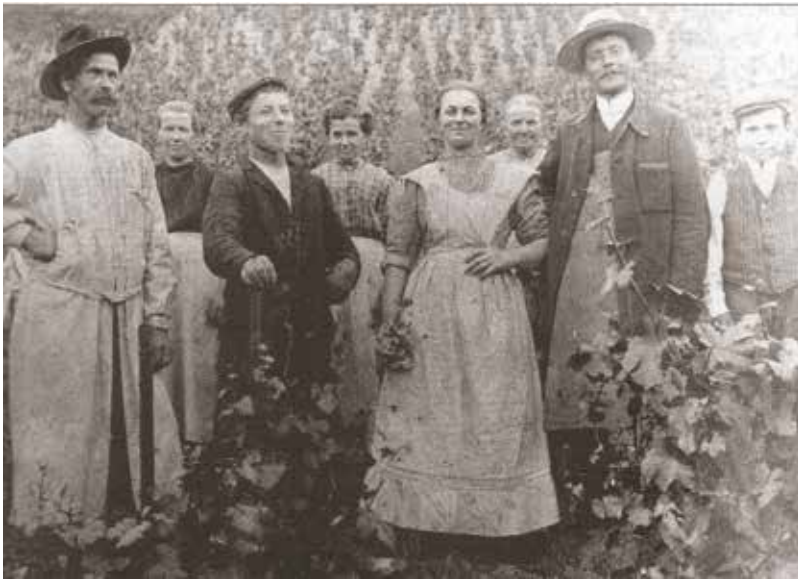
Benachbarte Weinbergbesitzer vor den fabrikeigenen Weinbergen der Firma Villeroy & Boch am Merziger Kreuzberg, um 1890.

tär« bezeichnet werden musste, kam nun endgültig zum Erliegen – aus diversen Gründen (u. a. unrentabel, bescheidene Trinkqualität). 9