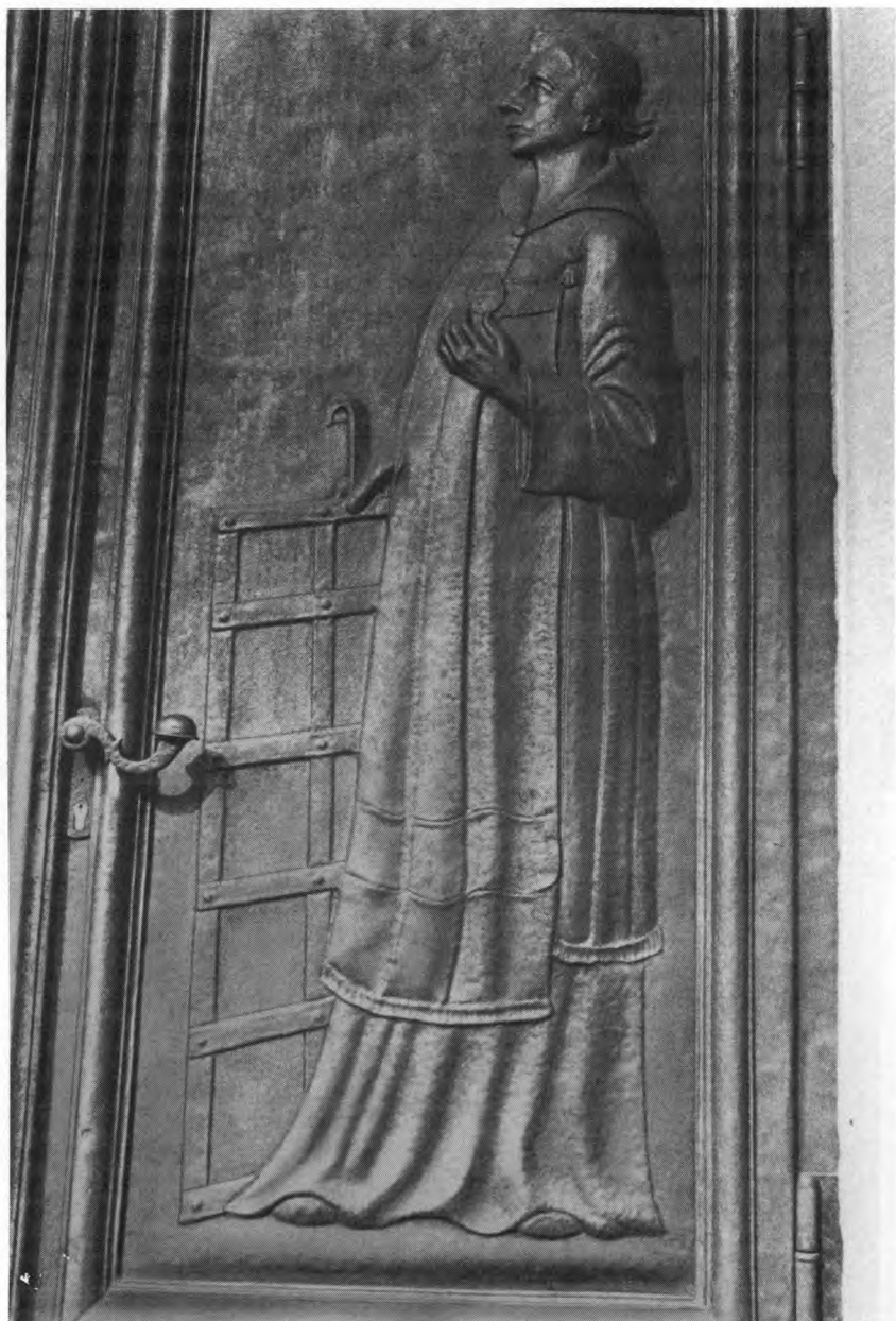
Bronzetür. St. Laurentius, Wiesloch