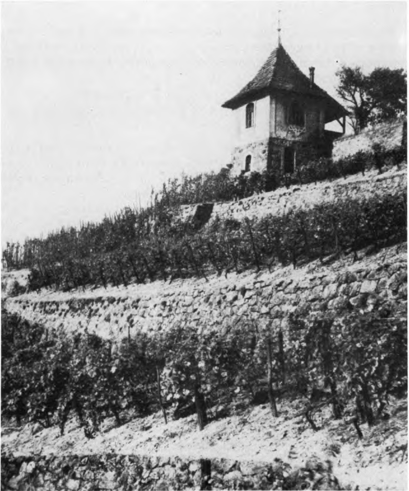
Weinberg mit Winzerhaus an der Bosel bei Meißen

Rebanbaufläche, von der jedoch nur ein geringer Teil im Ertrag stand. Als die aus Amerika eingeschleppten Schädlinge Peronospora , Oidium und die Reblaus etwa um 1887 im Elbtal auftraten und ihren verheerenden Feldzug gegen die Rebe begannen, schien es, als ob sich der Weinbau hier nicht mehr erholen würde.