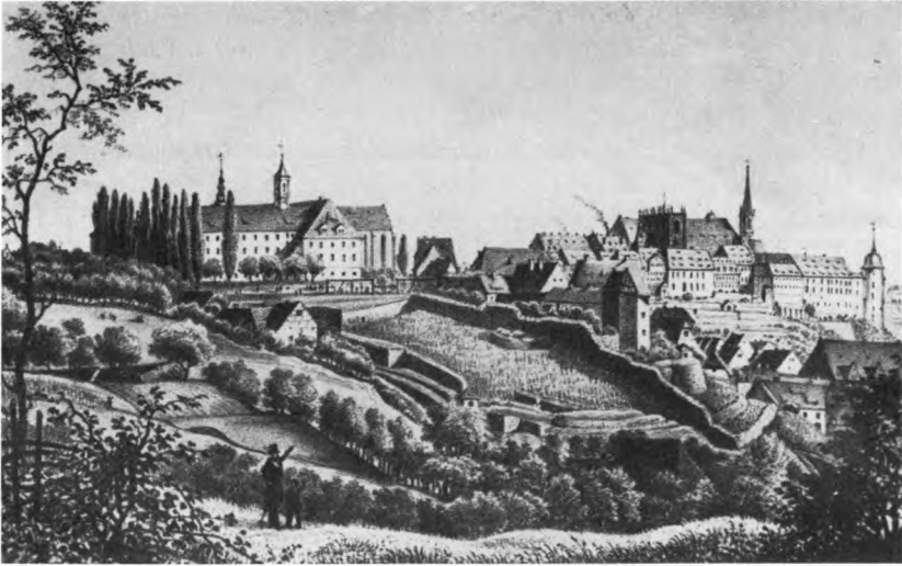
Meißener Burg mit Fürstenschule und Weinbergen

Marx-Stadt) und nach Böhmen (heutige ČSSR). Von dem Jahre 1460 an zeugen die Rechnungsbücher der Stadt Meißen fast 350 Jahre von ununterbrochenem Weinhandel mit Erträgen der städtischen Weinberge. Der Höhepunkt dieses Weinhandels lag eindeutig in der zweiten Hälfte des 16. Jahrhunderts. Zu diesem Zeitraum ist auch die größte Ausdehnung des Weinbaus im Elbtal festzustellen.