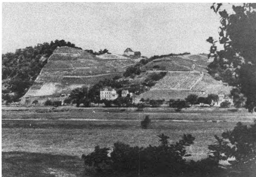
Weinberge an den Elbtalhängen des Spargeberges

In einem Rescript vom 8. November 1555 befahl Kurfürst August dem Schösser von Meißen unter Bezugnahme auf ein vom alten Kurfürsten Moritz wegen der Weinsteuer ergangenes Gesetz, „er solle von allem im