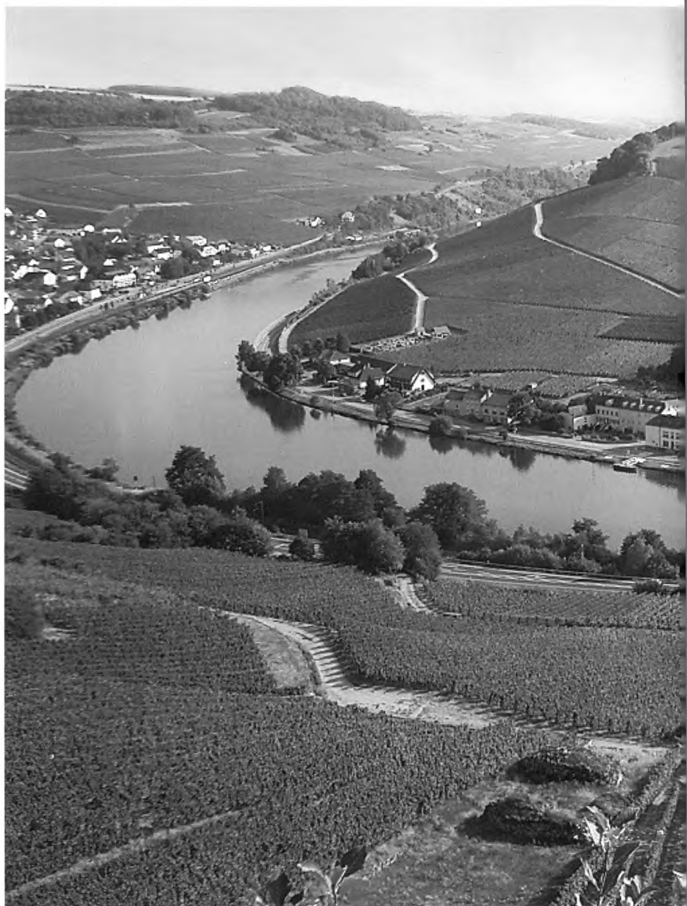
Machtum mit Ongkaf. Die Mosel bildet die Grenze zu Luxemburg. Am linken Bildrand Nittel