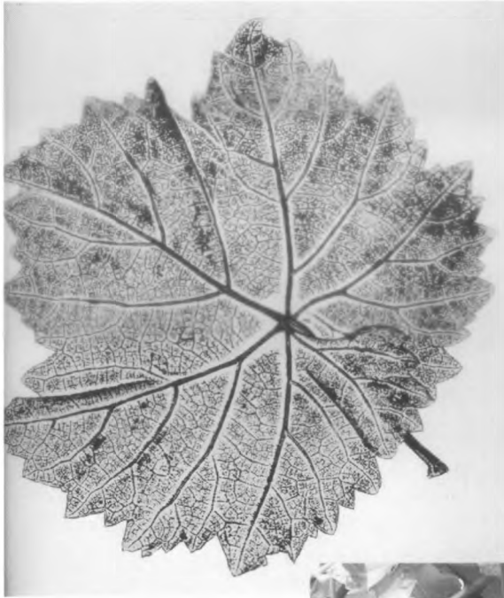
Weißer Elbling, Blattstruktur