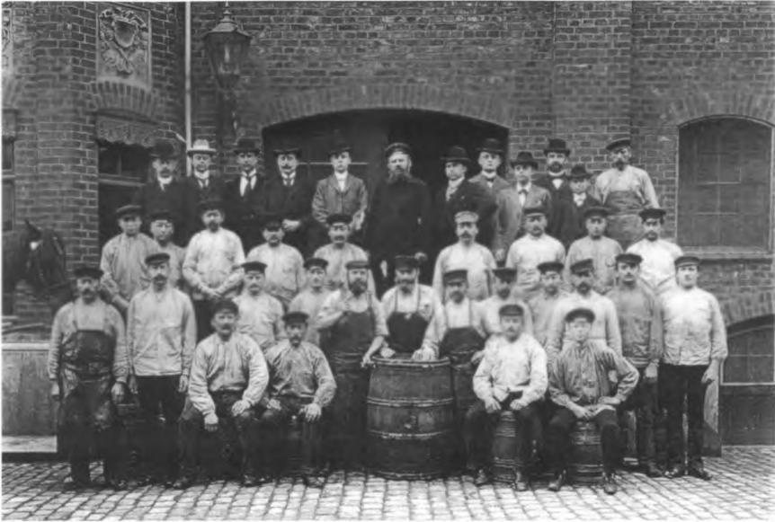
Lagerpersonal und Prokuristen der Weinfirma Reidemeister & Ulrichs

Handels eröffneten sich dann im Verlaufe des 19. Jahrhunderts, der Ausbau der Eisenbahn, so die Eröffnung der Strecke Bremen–Hannover im Jahre 1847, die Einrichtung neuer Schifffahrtlinien, wie die Hansareederei 1853 oder der Norddeutsche Lloyd 1856, nicht zuletzt die Gründung der Bremer Bank im Jahre 1855. Damit sind dynamische Entscheidungen bezeichnet, die den Weg Deutschlands zum Nationalstaat mit einem starken Wirtschaftspotential vorbereiteten und zugleich günstigere Rahmenbedingungen in der lokalen Handelslogistik und im Kapitalverkehr schufen. Sie kamen dem Weinhandel in Bremen außerordentlich zugute, der einen weiteren Aufschwung nach der Gründung des Deutschen Reiches 1871 und nach der Übernahme der deutschen Reichswährung 1872 nahm und mit der Eingliederung in das deutsche Zollgebiet 1888 einen gewissen Abschluss fand. Friedliche politische Verhältnisse, freier, bequemer und preiswerter Waren- und Kapitalverkehr – unter diesen Prämissen erlebte Bremen als Handelsplatz seine goldene Zeit zwischen 1890 und 1914. Man wird nicht fehlgehen in dem Urteil, dass dieser Höhepunkt der Entwicklung später nicht mehr erreicht wurde, auch nicht nach dem 2. Weltkrieg und