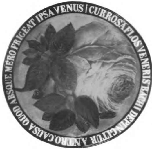
Die Rose im Rosekeller des Ratskellers in Bremen