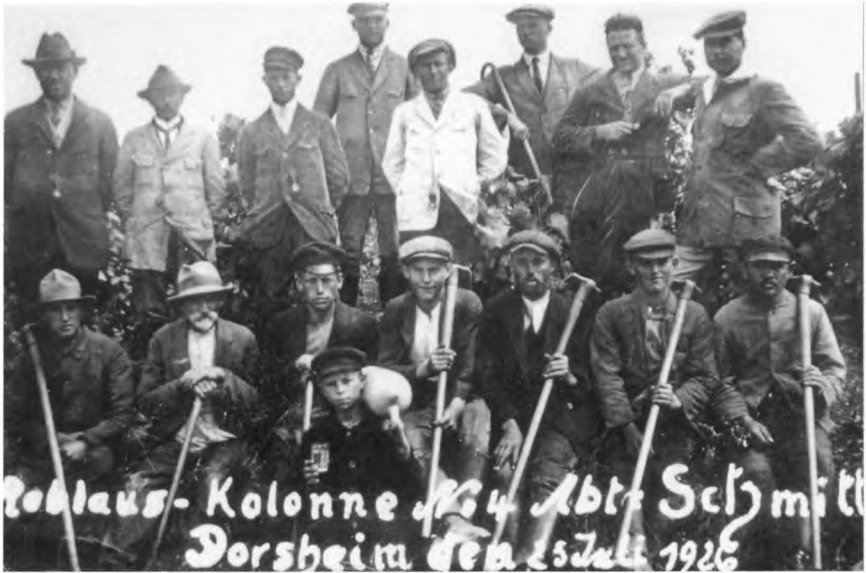
Weinort Dorheim. Reblauskolonne 1926.