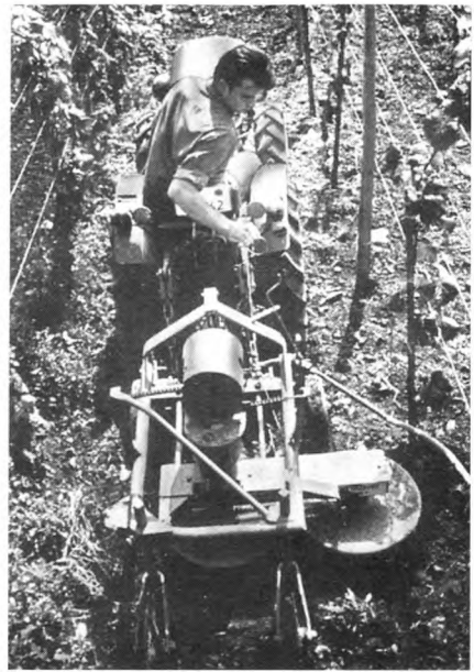
Bodenbearbeitung – einst und jetzt.

nach Wein zurückzuführen, wobei sich für den Nahewein aufgrund seiner Qualität gute Absatzmöglichkeiten ergaben.