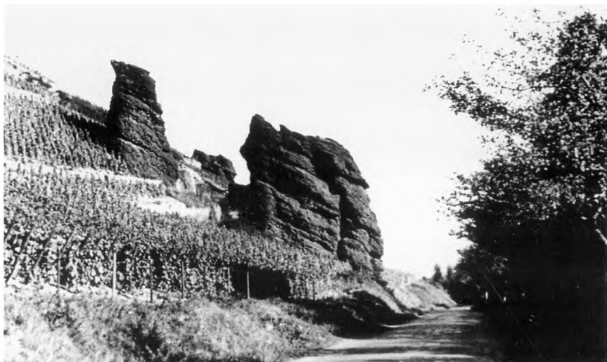
Trollbachtal, kurz vor Einmündung der Nahe in den Rhein. Felsen in den Weinbergen.