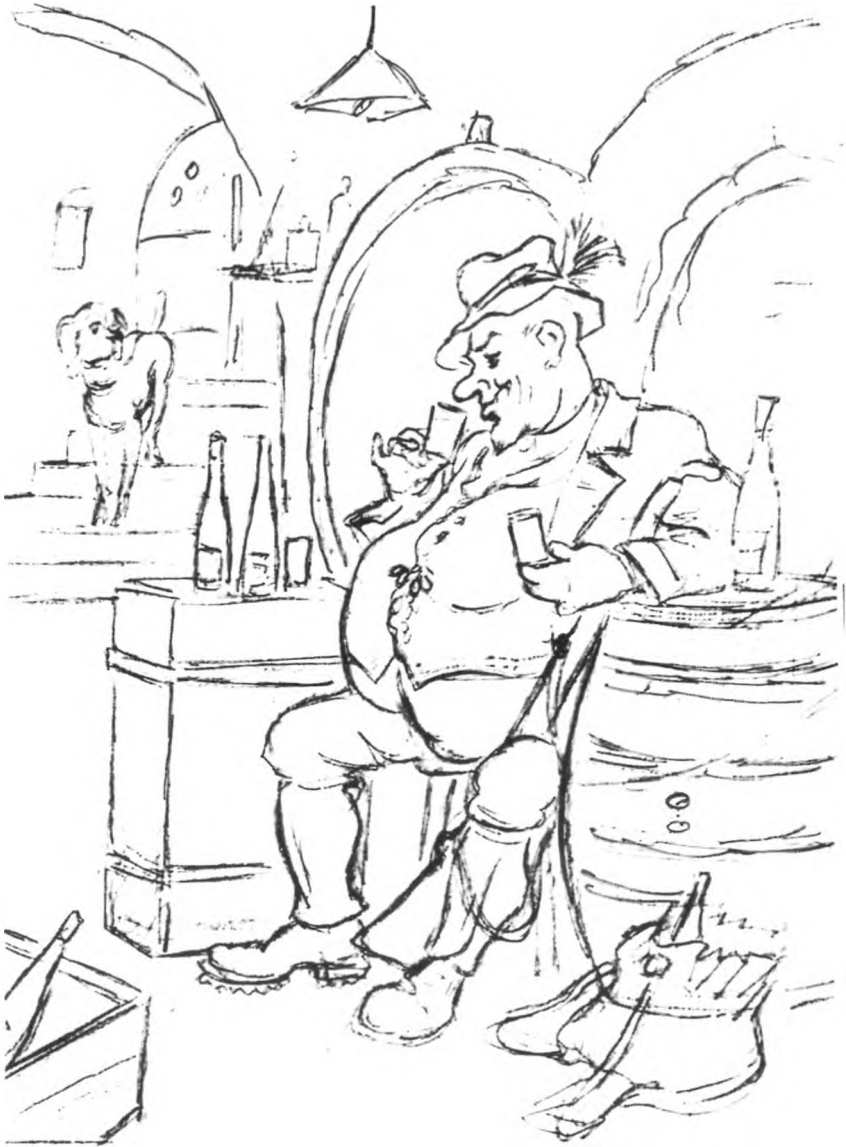
Der Nahewein schmeckt ihm. Bild des Kreuznacher Volkszeichners Jakob Thon.