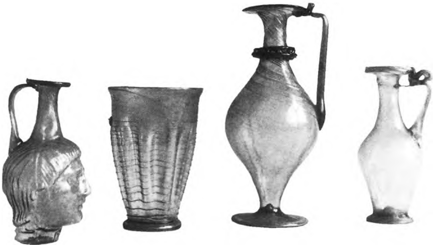
Weinkrüge und Weinglas aus der Römerzeit, im Schlossparkmuseum Bad Kreuznach.

Es besteht in der Forschung Einigkeit darüber, dass die Rebe und die Kenntnis der Weinbereitung zur Zeit der römischen Herrschaft über Westeuropa, also in der Zeit ab dem 1. Jahrhundert n. Chr., sich bis zum Rhein ausgebreitet haben. 3 Bodenfunde aus dem römischen Kastell in Bad Kreuznach (zwei römische Weinfliter und ein Rebmesser) und an der Nahemündung (römische Weinkrüge und ein Weinglas) werden von Fachleuten als Beweis für den Weinbau in der hiesigen Gegend während der Römerzeit angesehen. 4 Ein Skulpturenstück mit einer Rebe und Weintrauben, das in der römischen Villa in Bad Kreuznach gefunden wurde, deutet darauf hin, dass die in der Umgebung angepflanzte Rebe Vorbild für die künstlerische Darstellung war.