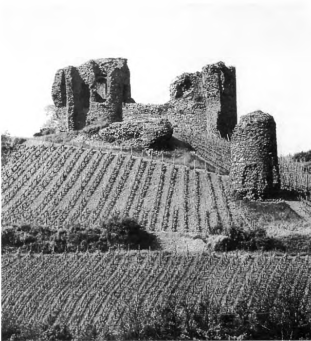
Weinort Gutenberg. Die Ruinen der Gutenberg mitten in Weinbergen.

Geblüte und seind also denenjenigen ungesund, die ihrer nicht gewohnt seind. 35 Der schon mehrfach erwähnte Goethe urteilte beim St. Rochusfest in Bingen in ähnlicher Weise: Der Nahewein soll sich leicht und angenehm trinken, aber doch, ehe man sich versieht, zu Kopfe steigen.