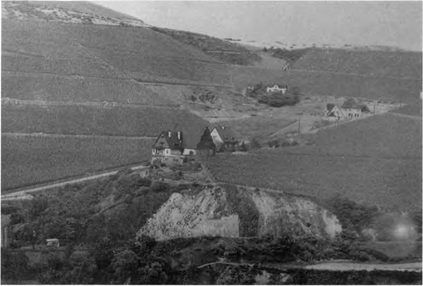
Weinbaudomäne Niederhausen-Schlossböckelheim. Gelände nach Anlage der Domäne 1903. In der Mitte die Betriebsgebäude.