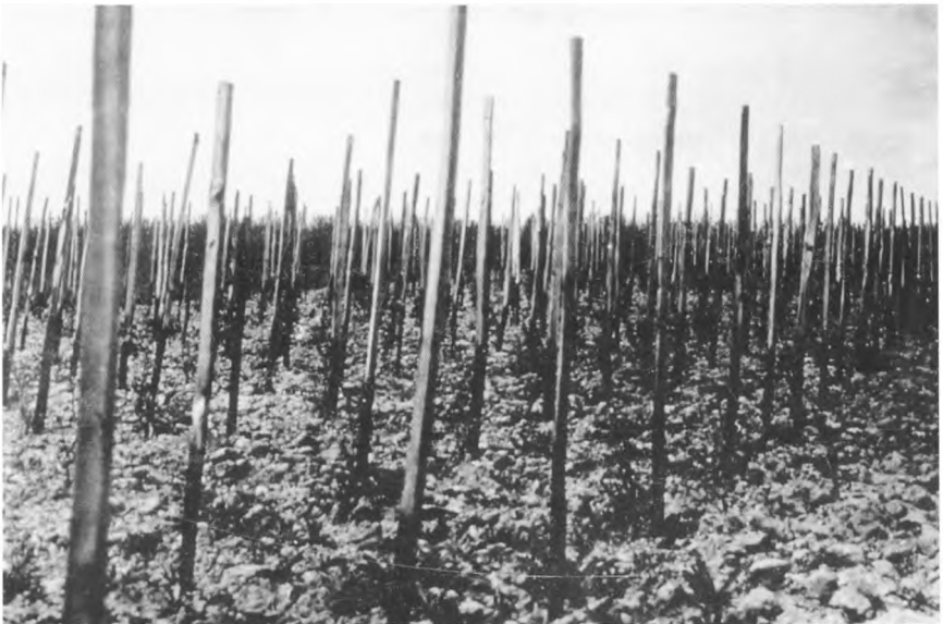
Pfahlwingert im Frühjahr.