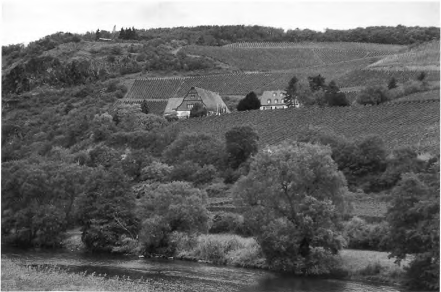
Gutsverwaltung Niederhausen-Schlossböckelheim heute.