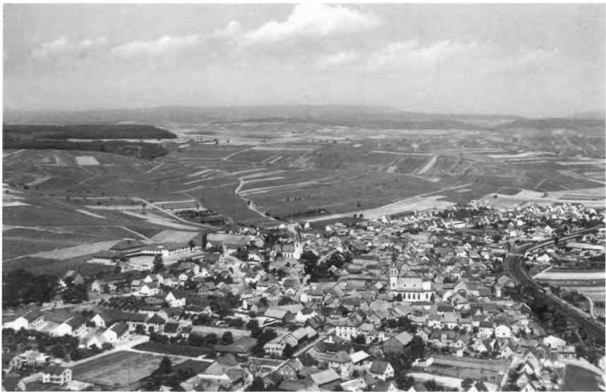
Weinberge im Hügelland der unteren Nahe. Im Hintergrund die bewaldeten Höhen des Soonwaldes.