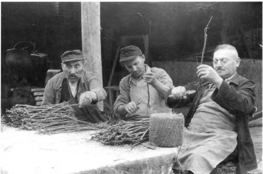
Herrichten von Pfropfreben zur Pflanzung.