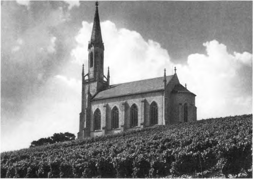
Weinort Waldböckelheim. Kirche in den Weinbergen.

waren. Die Anzahl der Weinbau treibenden Familien im Jahre 1817 wurde mit 1397 sicher zu niedrig angegeben; bis zum Jahre 1893 erhöhte sie sich auf 4684 und stieg bis 1925 auf 4834 Betriebe, die etwa 2800 ha bestockte Weinbergsfläche, daneben aber auch 15 800 ha Ackerland bewirtschafteten. Im Jahre 1911 besaßen zwei Drittel der Familienbetriebe an der Nahe weniger als einen halben Hektar Weinberge. 62