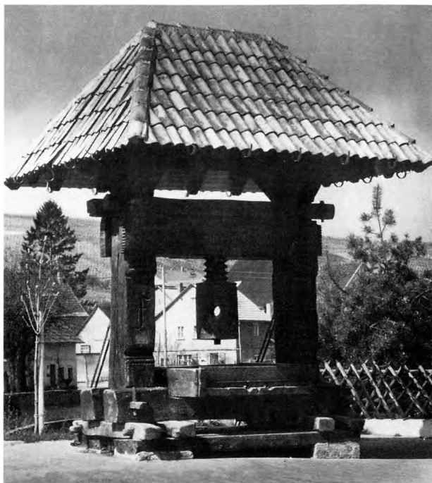
Weinort Guldental. Kelter aus dem Jahre 1708.