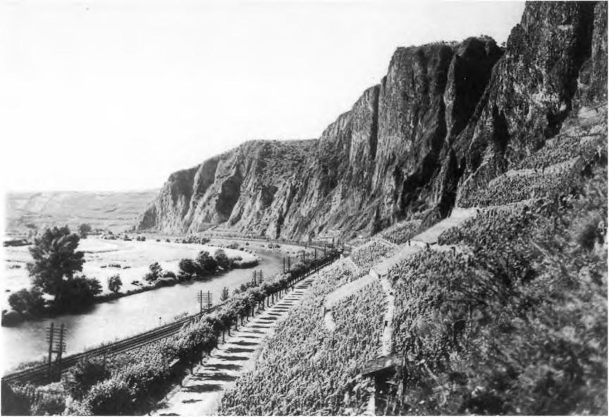
Rotenfels bei Bad Münster am Stein/Ebernburg mit den Terrassen der Weinbergslage „Traisener Bastei“, davor die Nahe.