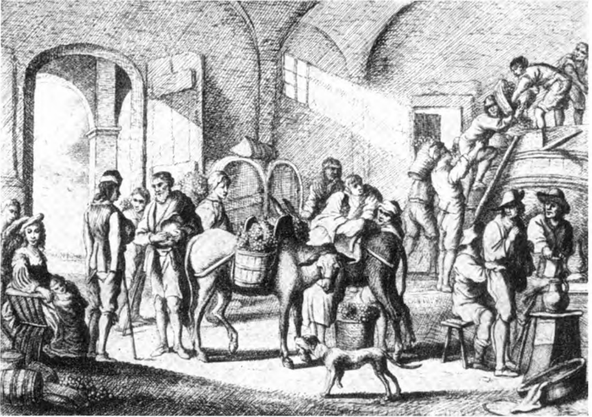
Arbeit an der Kelter im 18. Jahrhundert.

abgegrast und ebenso wie die abgeschnittenen langen Triebe des Rebstocks als Viehfutter verwendet.