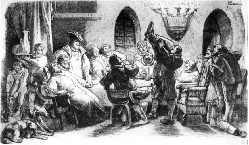
Stiefeltrunk beim Rheingrafen.

nonicum (hunischer Wein) mit Wasser vermischt wird, weil er von Natur aus wässerig ist. Als Äbtissin des Benediktinerinnen-Klosters St. Rupertsberg bei Bingen, das zahlreiche Weinberge im Nahegebiet besaß, dürfte sich Hildegard in Weinqualitäten gut ausgekannt haben. In ihre Naturheilverfahren zog sie den Wein als Heilmittel mit ein, denn der Wein heilt und erfreut den Menschen mit einer gesunden Wärme und mit seiner großen Kraft und Wein von der Traube, wenn er rein ist, macht dem Trinker das Blut gut und gesund. 24