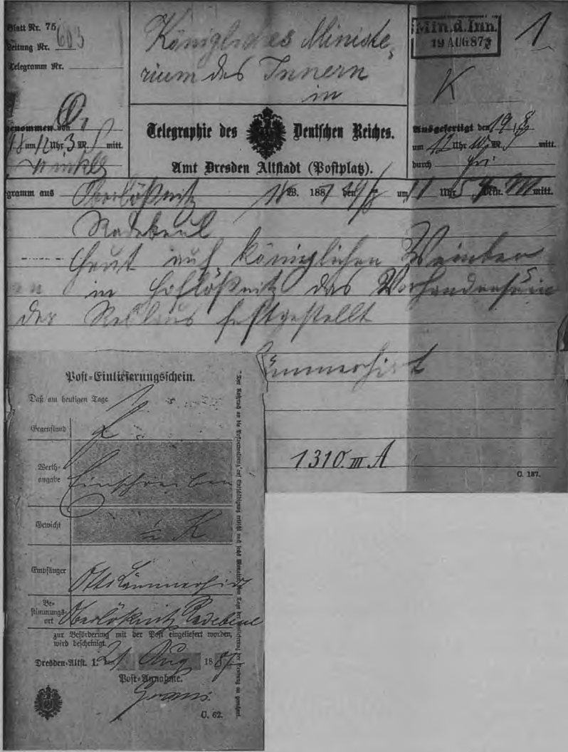
Dieses Telegramm vom 19.8.1887 dokumentiert den ältesten Reblausnachweis in Sachsen.